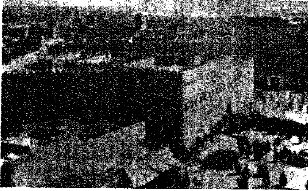
الرياض، أيام الملك عبد العزيز