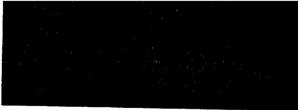
حفول الأرز في الهفوف

لم تكن محاربة الأتراك خبرة جديدة بالنسبة إلى ابن سعود، ذلك أنه كان قد لاقى، مرة بعد أخرى، فصائل تركية، وبخاصة مدفعية الميدان، ضمن جيوش ابن الرشيد، ولكن الهجوم على الأحساء، التي كان يحكمها الأتراك مباشرة، كان شيئاً آخر مختلفاً تماماً، ذلك أنه يجعله يصطدم بدولة عظمى وجهاً لوجه. ولكن ابن سعود لم يكن باستطاعته أن يختار، فما لم يخضع الإحساء وميناءها لسيطرته فإنه يبقى معزولاً عن العالم الخارجي دائماً، وغير قادر على أن يحصل على ما كان في أمس الحاجة إليه من الأسلحة والذخائر وكثير من ضروريات الحياة. كانت الغاية تبرر المغامرة، ولكن الخطر كان كبيراً جداً، حتى أن ابن سعود تردد طويلاً قبل أن يقوم بأي هجوم على الأحساء وعاصمتها، الهفوف. وهو لا يزال مولعاً، حتى الآن بأن يروي الظروف التي اتخذ فيها قراره النهائي.