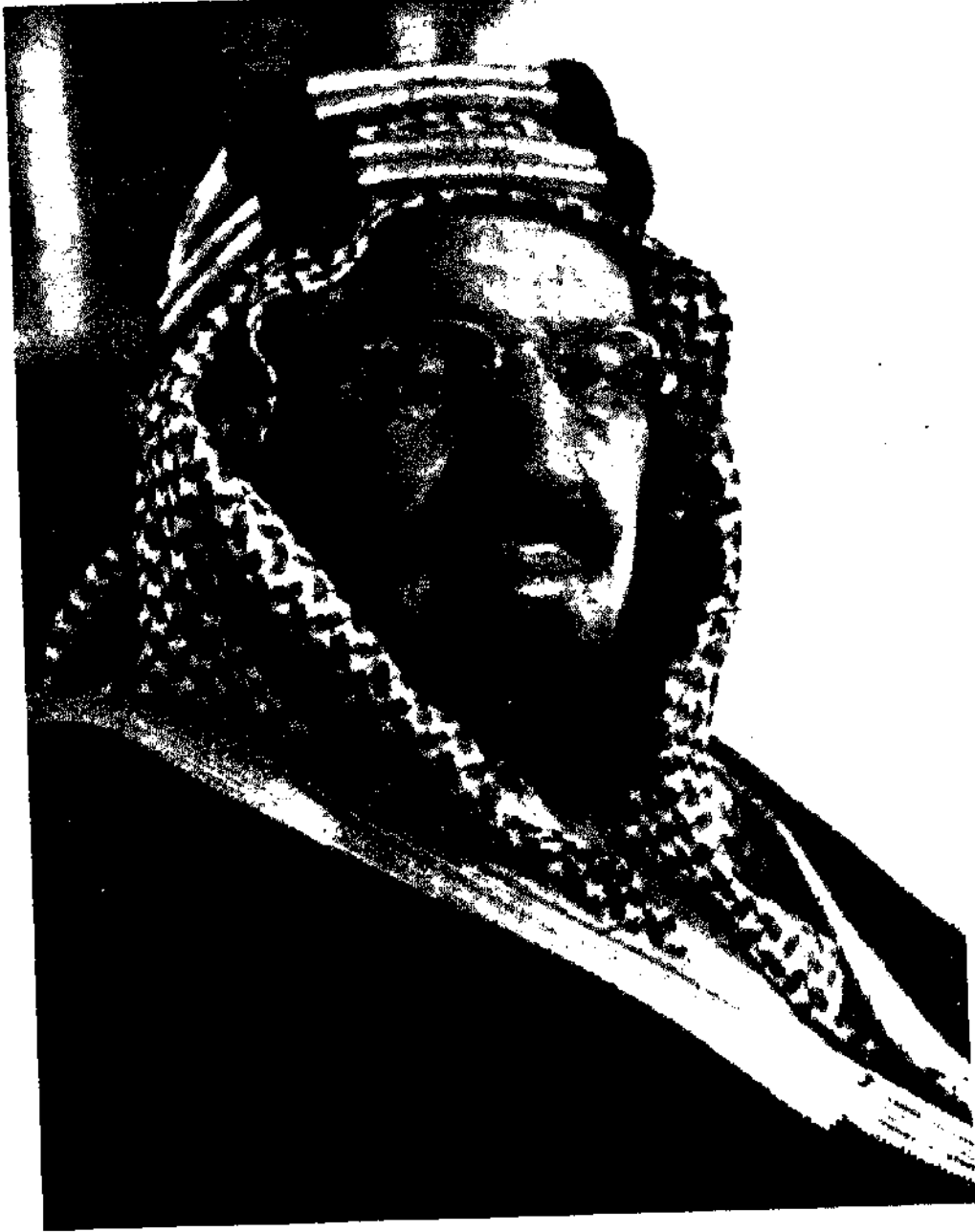
الملك عبد العزيز، تغمده الله برحمته